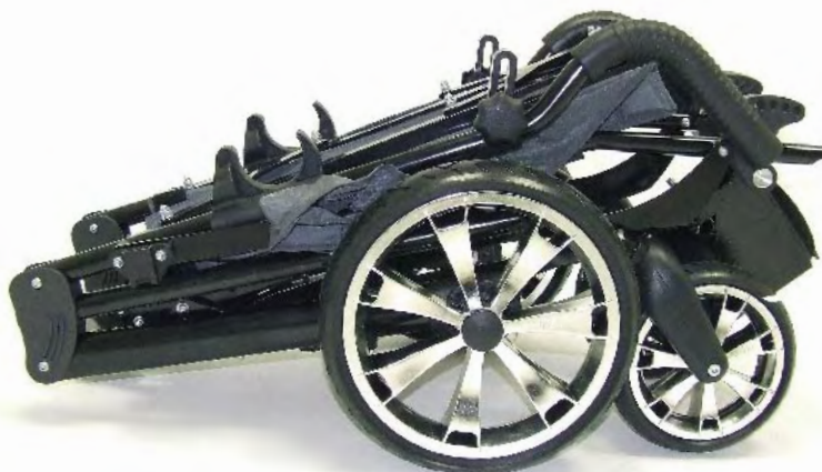
• ZIP® Buggy