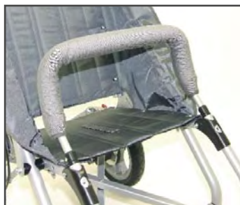
Бампер ограждения с мягкой обивкой