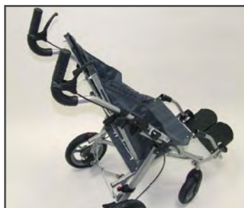
Ручной тормоз для сопровождающего