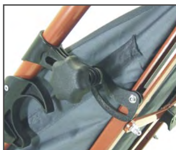
Увеличение угла спинки до 105°