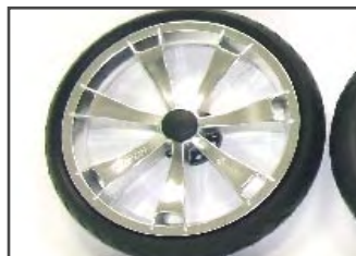
Варианты колёс: Обод с алюминиевым эффектом полиуретановые шины