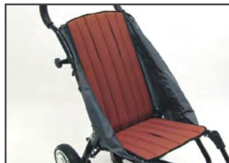
Цвет мягкой обивки: Красный