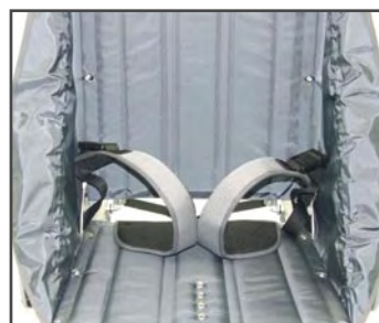
Закрепляющие ремни в виде штанов