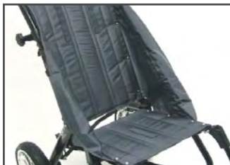
Цвет покрытия: Серый