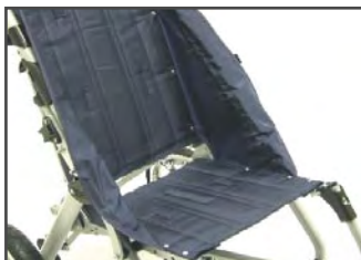
Цвет покрытия: Морская волна