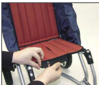
Складывающаяся подушка сиденья