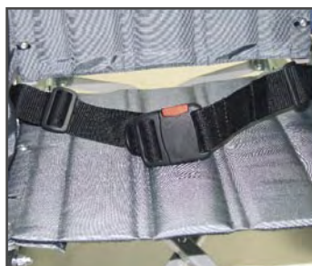
Поясной ремень безопасности