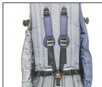
5-ти точечный ремень безопасности