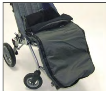
Зимний чехол для ног