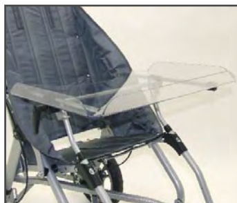
Столик для терапии