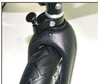
Блокировка для колёс