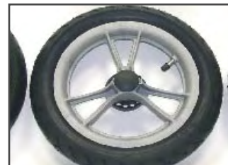
Варианты колёс: Пластиковый обод с пневматическими шинами