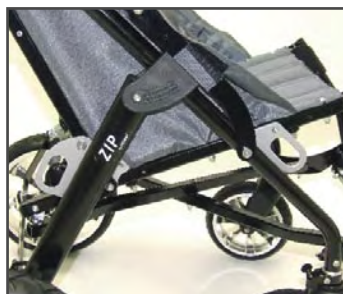
Безопасность движения согласно норм ISO 7176-19