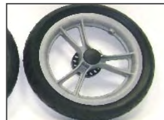
Варианты колёс: Пластиковый обод с полиуретановыми шинами