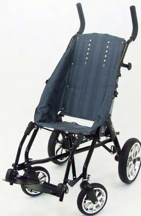
Reha - Faltuggy