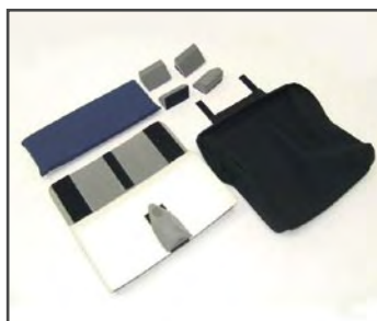
Многосекционная с чёткими контурами подушка для сиденья