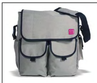
Дополнительная сумка для аксессуаров