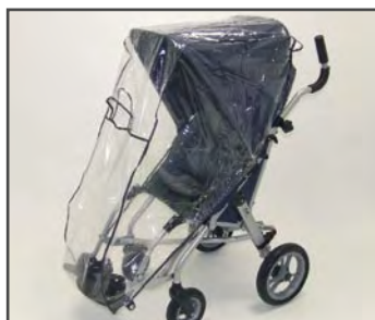
Козырёк, включая адаптер и защиту от дождя