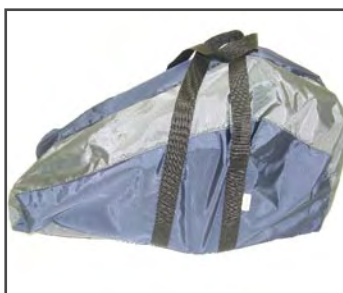
Чехол для транспортировки