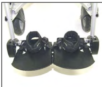
Ремень для голеностопных суставов