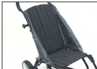
Цвет мягкой обивки: Чёрный