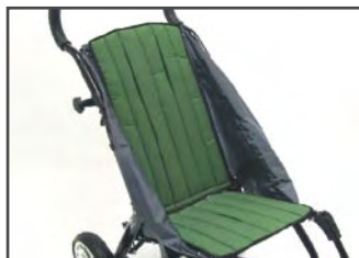
Цвет мягкой обивки: Зелёный